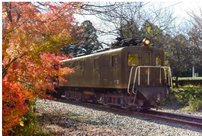
【大井川鐵道EL (イメージ) ※11/24 から運行となります。】

出発日 令和3年11月13日(土)～11月28日(日) 最少催行人員 2名様より催行(募集人員各出発日20名様)