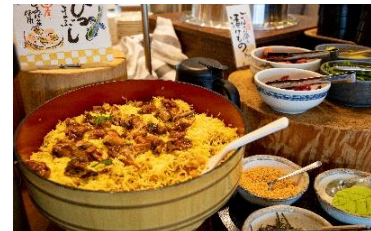
川根温泉ホテル お食事例

※掲載写真は全てイメージです。S LやE Lは当日の車両と異なる場合がございます。