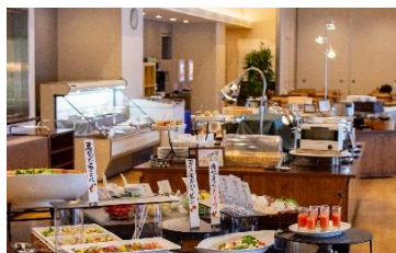
川根温泉ホテル お食事例