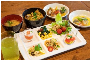
川根温泉ホテル お食事例