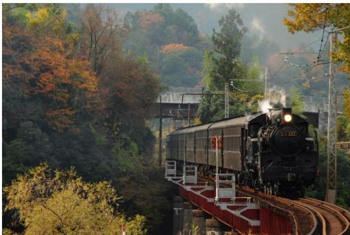
【大井川鐵道SL (イメージ) ※11/23 までの運行となります。】