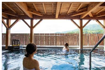
川根温泉ホテル・露天風呂

★小人2名様以上でお申込みください。大人1名様・幼児1名様でご利用の場合、幼児の方は小人代金となります。 ★お部屋のお布団はご自由にお使いいただけます（1部屋5組まで用意あり）。 ※幼児の年齢はご出発日当日の年齢となり、1歳～未就学児が対象です。（S L 座席あり・弁当あり・食事あり） ※0歳児S Lの座席が必要な場合は、幼児にてお申込みください。