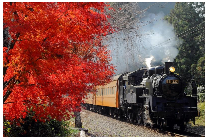
【秋の大井川鐵道S L (イメージ)】