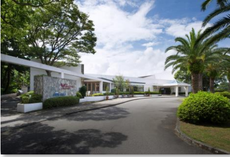
静波スウィングビーチ (外観)